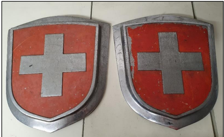
Die neuen, alten Lokschilder

Parallel zu den ersten Arbeiten haben wir uns auf die Suche nach Wappen, Fabrikschilder und Zahlen sowie Buchstaben gemacht. Dank grosszügigen Spendern haben wir es geschafft diese nun aufzutreiben.