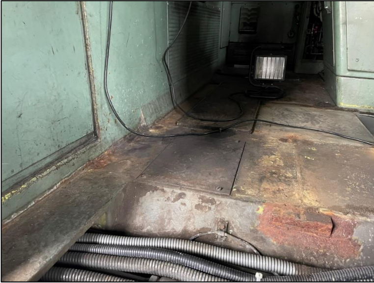
Unterboden im Führerstand

der Kleber und der Dachverkleidungen. Weiter ist es notwendig die Fussböden in den Führerständen zu ersetzen.