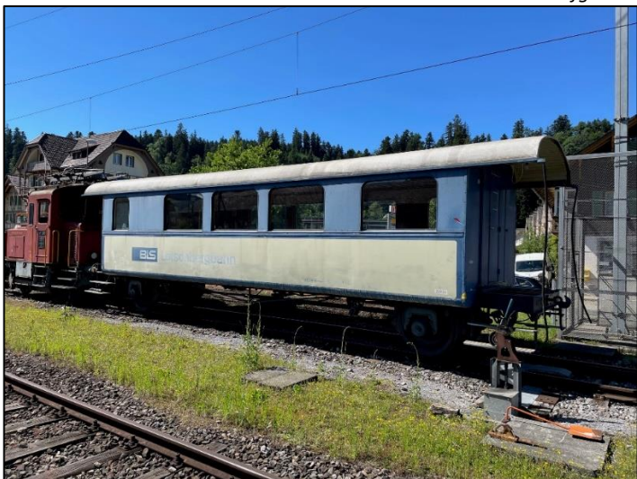
Schöner Guisanwagen, aber ein Neuanstrich ist fällig