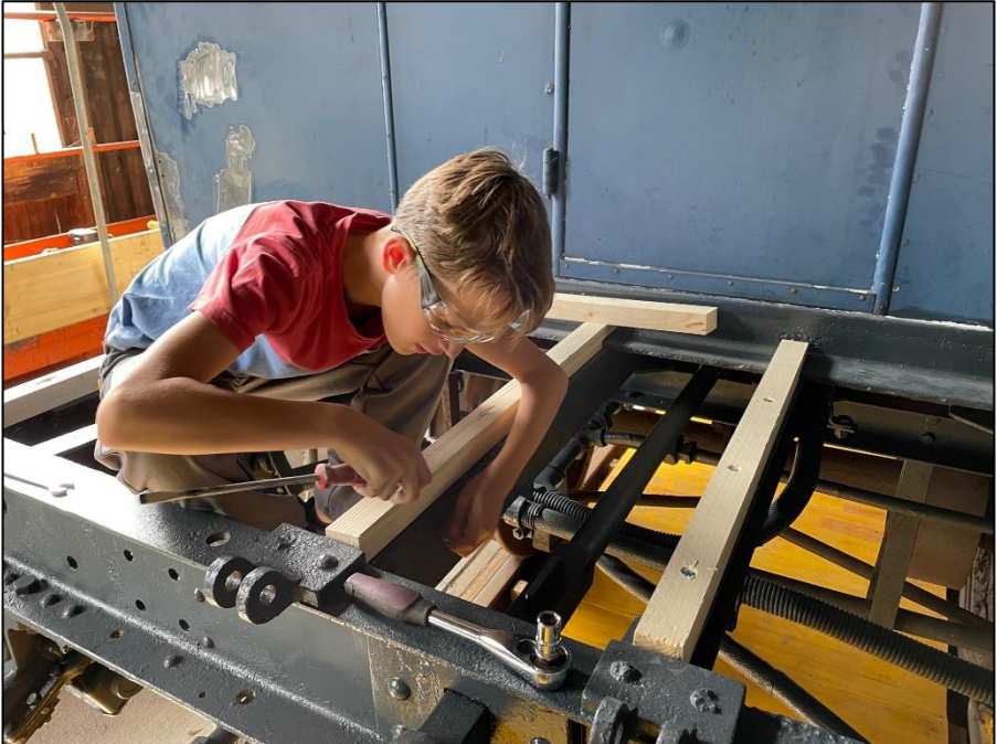
Finn an der Arbeit

Im Jahr 2022 war die neue Lok ein wahrer Höhepunkt, aber auch viele andere Aktivitäten sind es wert erwähnt zu werden.