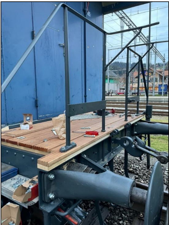
Die aufgearbeiteten Plattformen

Am Guisanwagen gehen die Arbeiten zur Sanierung der Plattformen gut voran. Diese sind nun fast abgeschlossen und in einem nächsten Schritt kann es an den Neuanstrich gehen. Das Elektrische wurde durch ein Vereinsmitglied und einen befreundeten Elektriker saniert.