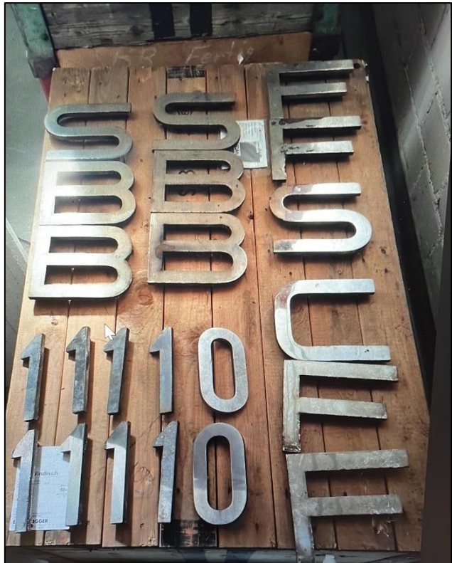
Die Buchstaben sind da