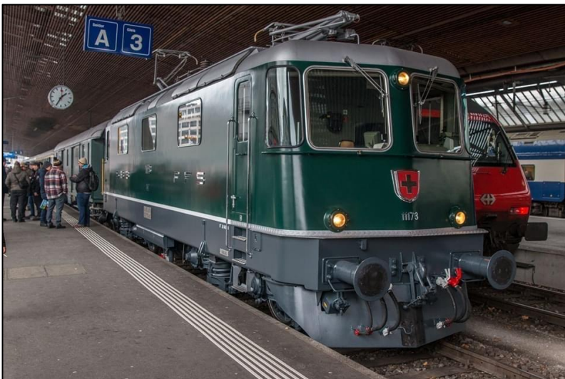
So könnte unsere Lok auch mal ansehen, hier die 11173 des DSF