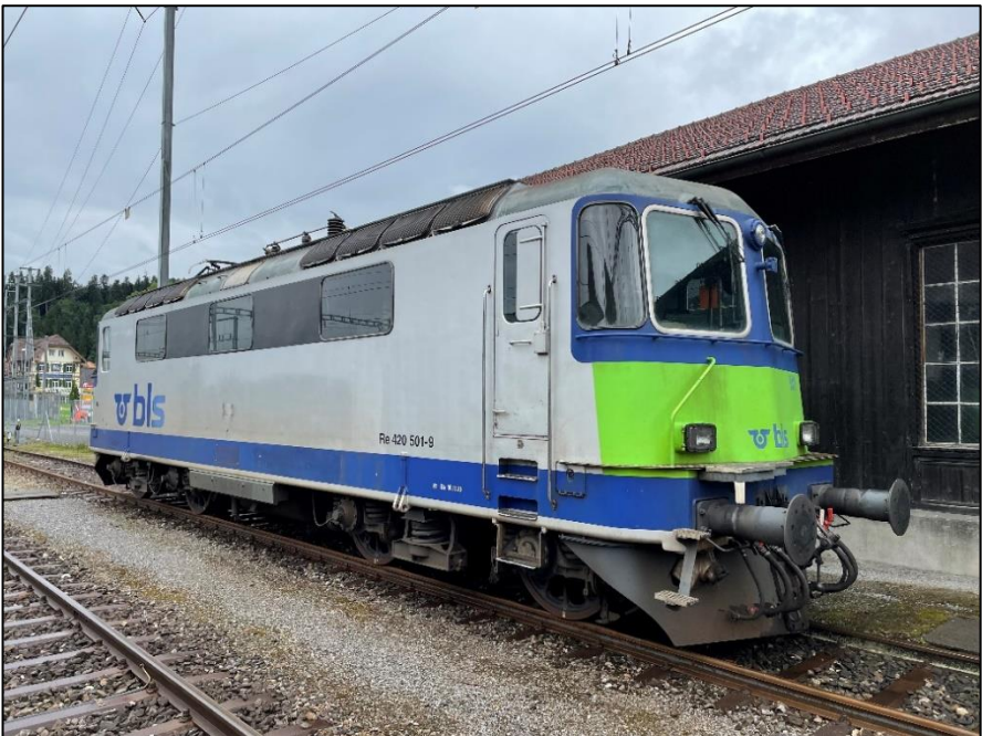
Unsere 11110 ist da

Sie ist da – unsere Re 4/4 II – unsere BoBo wie sie von vielen Bahnfreunden auch einfach genannt wird. Damit konnte ein grosser Wunsch in Erfüllung gehen. Wir haben endlich wieder eine eigene Lok, wenn es auch noch einiges zu tun gibt, bis sie wieder fährt. Aber auch hier: gut Ding will Weile haben. Danke an alle, welche sich auch hier finanziell sehr engagiert haben oder mit dem Hand anlegen. Nach der Übergabe der Lok am 1. Juli 2022 konnten wir uns rasch an die ersten Arbeiten machen.