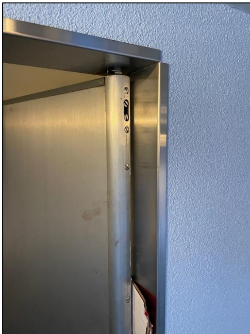
Die WC-Türe ist nun auch verkleidet

Auch in der Lokremise gingen weitere Arbeiten voran. Insbesondere konnten die Arbeiten im WC-Container fertiggestellt werden. Im Aussengelände ging die Eindeckung mit Mergel weiter.